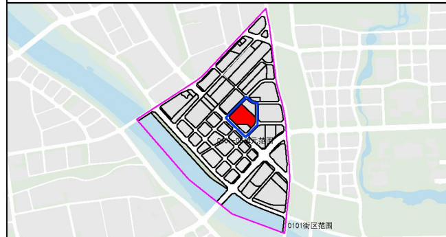
地块规划控制指标表